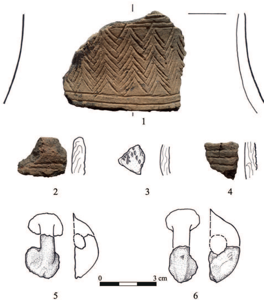
Ryc. 2. Chwarstnica, stan. 3. Wybór fragmentów ceramiki kultury ceramiki sznurowej z odkryć w 2010 roku: 1-4 – fragmenty pucharków; 5-6 – fragmenty uszek (rys. M. Dziewanowski, A. Ryś) Fig. 2. Chwarstnica, site 3. Selection of the Corded Ware culture potsherds from discoveries in 2010: 1-4 – sherds of the beakers; 5-6 – sherds of the handles (drawn by M. Dziewanowski, A. Ryś)