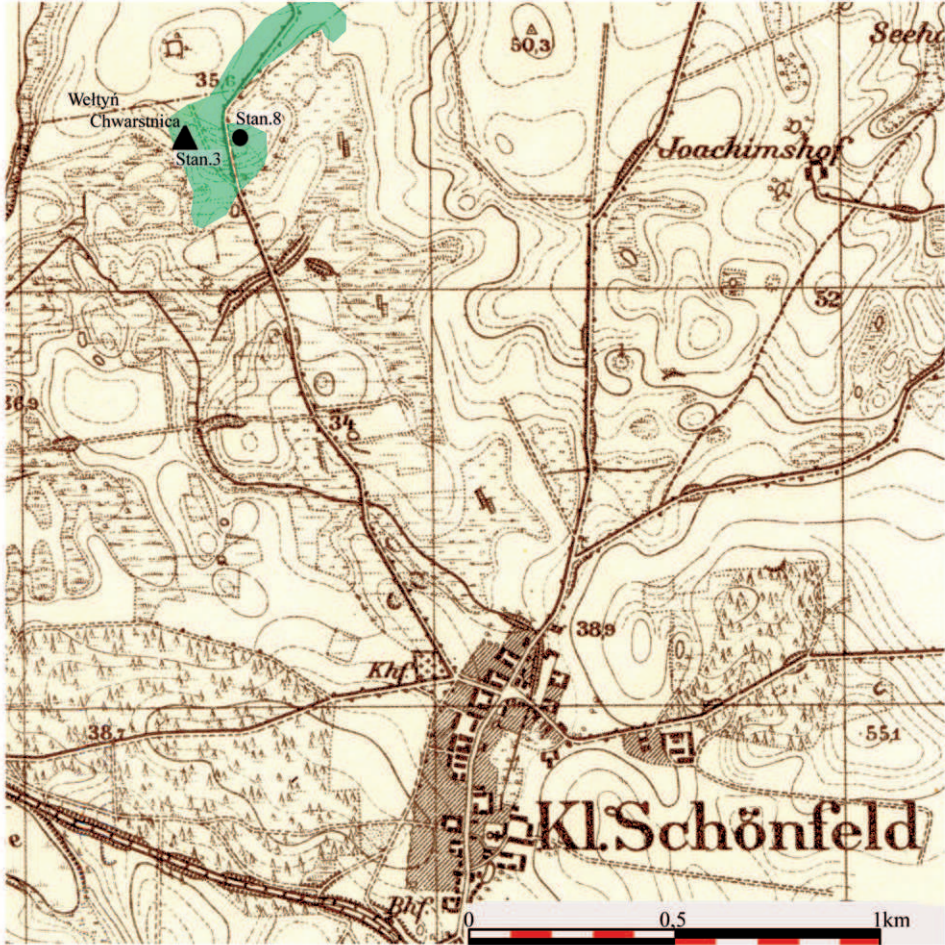
Ryc. 1. Lokalizacja stanowisk nr 3 i 8 w Chwarstnicy na podkładzie mapy z 1929 roku (oprac. M. Dziewanowski)