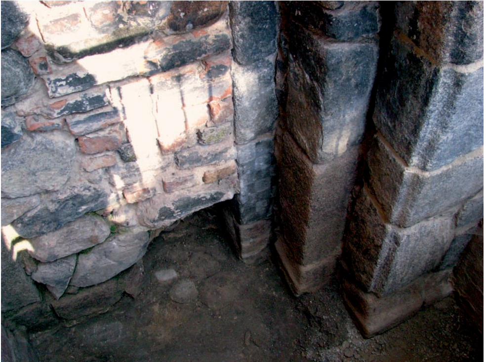
Ryc. 3. Myślibórz, pow. myśliborski. Portal z widoczną kwadrą z motywem szachownicy, fot. M. Szymczyk