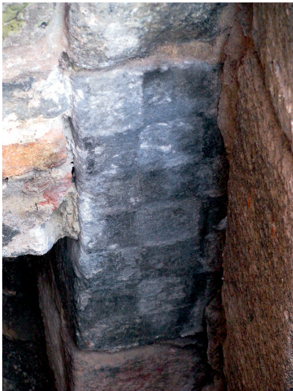
Ryc. 2. Myślubórz, pow. myśliborski. Kwadra z motywem szachownicy Fig. 2. Myślubórz, Myślubórz district. Quarter with the chequered pattern