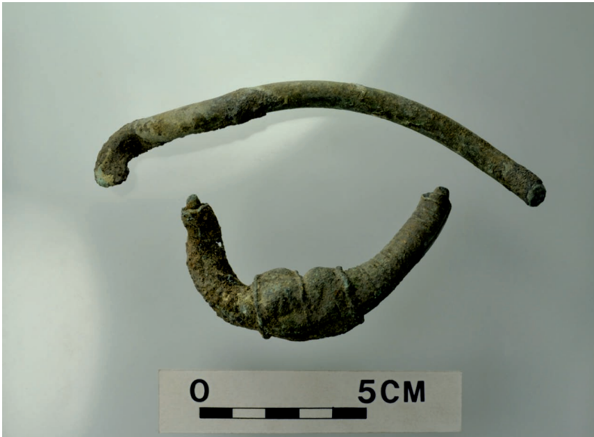
Ryc. 1. Fragmenty naszyjnika z cylindrycznymi końcami z dawnej Kol. Hohenheide, Kr. Regenwalde.