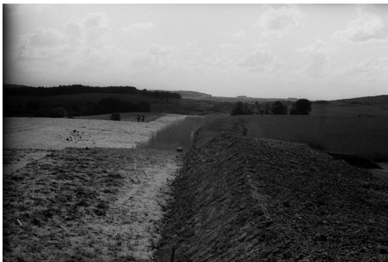
Ryc. 4. Prospekcja powierzchniowa odhumusowanego odcinka autostrady R.A.B. na wysokości Brzeźniaka, pow. łobeski, 9 VI 1939 r. Archiwum DA MNS, negatyw nr F51.7

Fig. 3. Otto Kunkel (on the right) inspecting construction of R.A.B. in the area of Brzeźniak, Łobez district on June 9, 1939. In the background: embankment of the motorway. The MNS Department of Archaeology Archives, negative No. F51.12