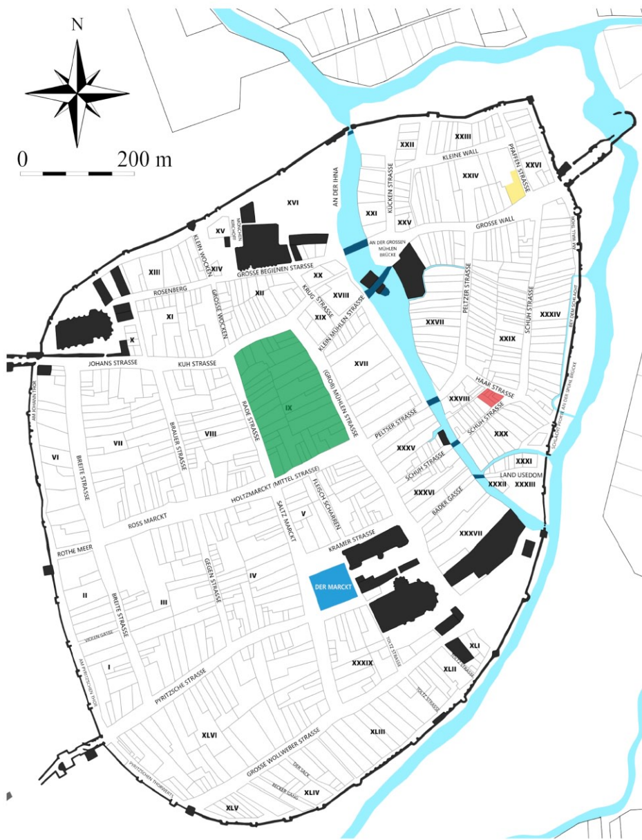
Ryc. 1. Stargard, Stare Miasto. Plan miasta według M.F. Schwedtkena z 1724 roku z zaznaczonym terenem badań archeologicznych, podczas których odkryto zapinki: kolor zielony – kwartał IX; kolor żółty – kwartał XXIV; kolor czerwony – kwartał XXVIII; kolor niebieski – Rynek Staromiejski. Kreślił i oprac. M. Szeremeta