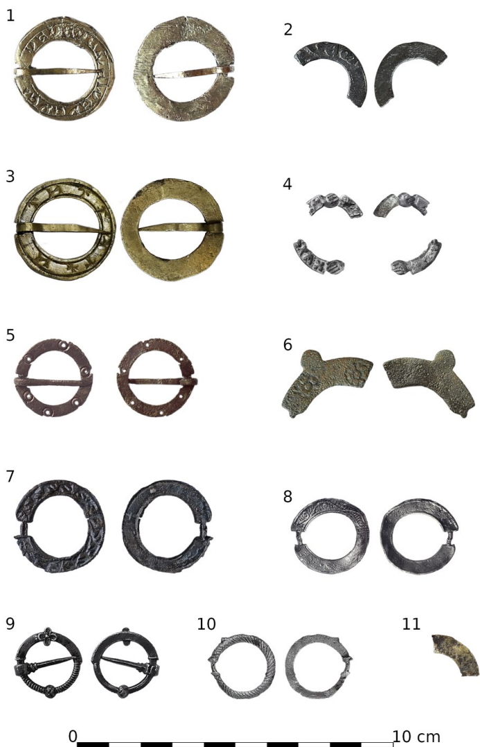
Ryc. 2. Stargard, Stare Miasto. Zapinki: 1 – nr inw. 118/24/GW/S, kwartał XXIV; 2 – nr inw. MS/A/262/7a; 3 – nr inw. 234/R/S, Rynek Staromiejski; 4 – nr inw. 195/R/S, Rynek Staromiejski; 5 – 170/H/Kw/S, kwartał IX; 6 – nr inw. MS/A/262/7b; 7 – nr inw. 252/R/S, Rynek Staromiejski; 8 – nr inw. 1419/Sch/28/S, kwartał XXVIII; 9 – nr inw. 1235/Sch/28/S, kwartał XXVIII; 10 – nr inw. 1739/Sch/28/S, kwartał XXVIII; 11 – nr inw. 214/R/S, Rynek Staromiejski. Fot. I. Wojciechowska (1, 2, 4–11) i M. Szeremeta (3). Oprac. I. Wojciechowska