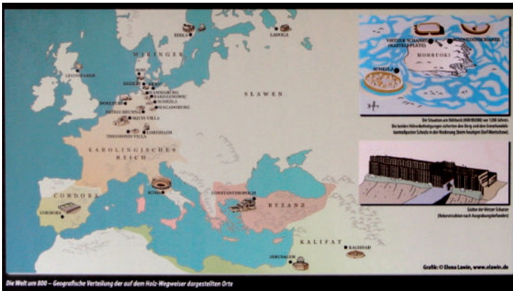
Abb. 17. Einfache Karte, die die Texttafeln ergnzt, indem sie die geografische Lage der auf dem Wegweiser genannten Orte zeigt und derart schematisch die „Welt um 800“ aus der Sicht des castellum hohbuoki darstellt Fig. 17. Map supplementing the text panels by showing geographical location of places mentioned on the signpost and thus schematically depicting the “World around 800” from the point of view of the castellum hohbuoki Ryc. 17. Schematyczna mapa uzupełniająca tablice tekstowe, pokazująca lokalizację miejsc wspomnianych w tekście, przedstawiająca znany świat około roku 800 z perspektywy castellum hohbuoki