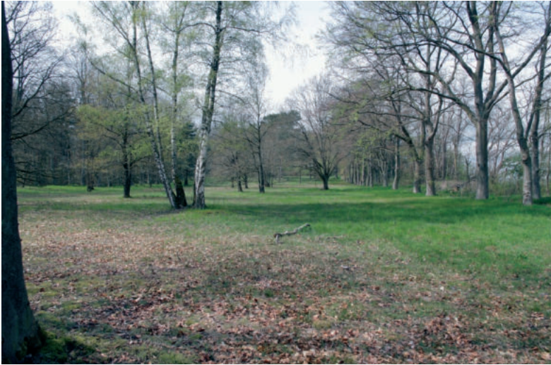
Abb. 8. Zustand des „Kastellplatzes“ (Innenfläche der Vietzer Schanze) im Frühjahr 2021. Unterholz und Strauchbestand sind weitgehend entfernt, sodass die einst umschlossene Fläche wahrgenommen werden kann

Fig. 8. “Fort square” (inner area of the Vietzer Schanze ) in the spring of 2021. Undergrowth and shrubs have largely been removed so that the once enclosed area can be seen