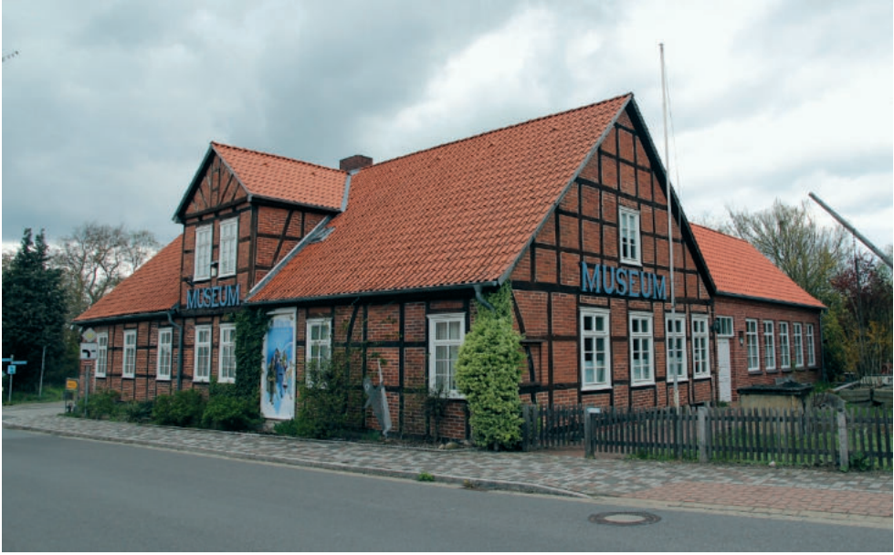
Abb. 18. Das Höhbeck-Museum in Vietze, das unter anderem über eine sehr gute Sammlung zur Archäologie der Höhbeckregion verfügt. Es wurde in den letzten Jahren modernisiert und erweitert. Eine Neukonzeption der archäologischen Dauerausstellung ist für die nächste Zukunft geplant

Fig. 18. The Höhbeck Museum in Vietze which has e.g. an extensive archaeological collection from the Höhbeck region. It has been modernized and expanded in recent years. A redesign of the permanent archaeological exhibition is planned in the near future