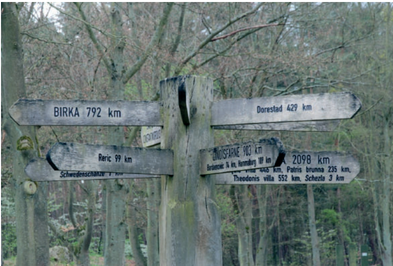
Abb. 15. Ein Wegweiser kontextualisiert die Vietzer Schanze als castellum hohbuoki Karls des Großen, indem er auf wichtige Orte aus der Welt um 800 verweist Fig. 15. Signpost contextualizes the Vietzer Schanze as the castellum hohbuoki of Charlemagne by referring to important places from around the world around the year 800 Ryc. 15. Znak umieszczający Vietzer Schanze w kontekście castellum hohbuoki Karola Wielkiego, z odniesieniami do ważnych miejsc na świecie ok. roku 800