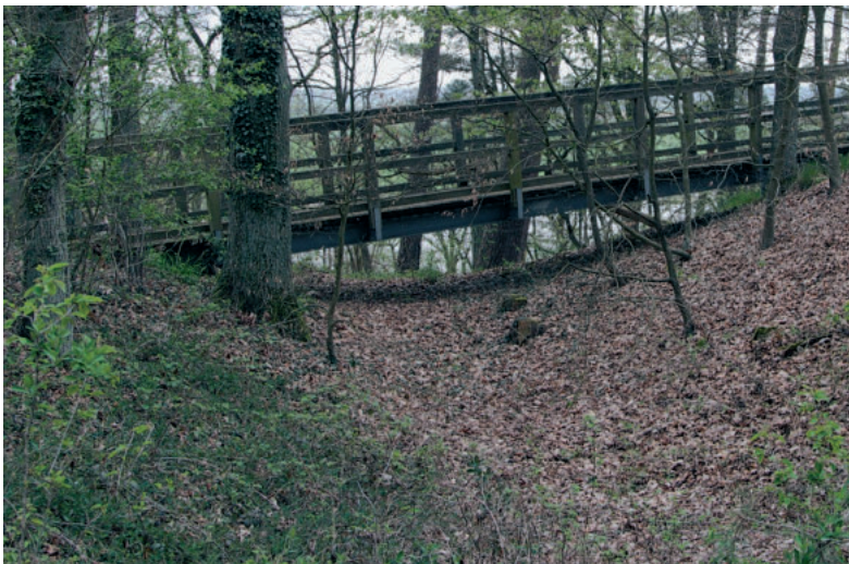
Abb. 9. Der Zugang von Westen führt nun auf einer hölzernen Brücke über den Burggraben

Ryc. 8. Stan zachowania grodziska (majdan Vietzer Schanze ) wiosną 2021. Małe drzewa i krzewy zostały usunięte w celu ekspozycji stanowiska