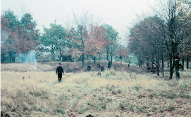
Abb. 3. Ausgrabungen von Ernst Sprockhoff in der Innenfläche der Vietzer Schanze in den 1950er Jahren. Im Hintergrund ist das Megalithdenkmal auf dem Ostwall zu erkennen.