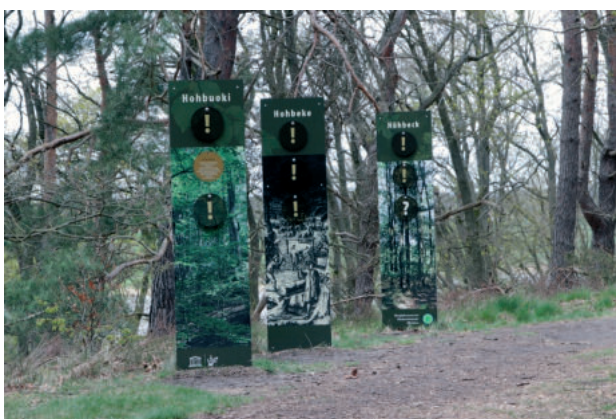
Abb. 13. Ein sogenannter Entdeckerpfad führt zu 20 Stelengruppen auf dem Höhbeck, die auf unterhaltsame Weise natur- und kulturgeschichtliches Wissen vermitteln. Auch die Geschichte des Höhbeck-Namens, die eng mit dem castellum hohbuoki verknüpft ist, wird thematisiert

Ryc. 12. Przy południowym wejściu ustawiono trzy tablice informacyjne tłumaczące historię badań Vietzer Schanze . Są one częścią szlaku odkryć i ustawiono je w miejscu starszych tablic