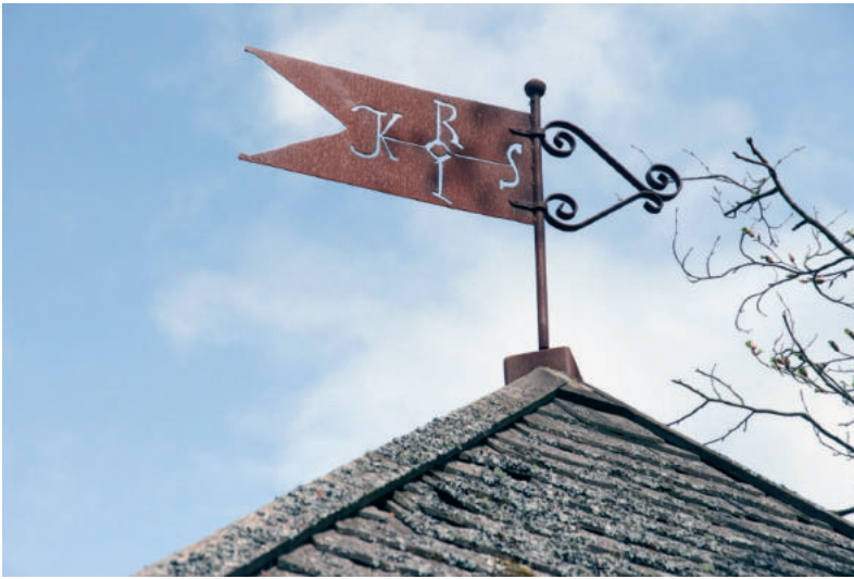
Abb. 14. Die eiserne Wetterfahne auf dem Schutzhäuschen zeigt die Insignien Karls des Großen Fig. 14. Iron weather vane on the shelter showing the insignia of Charlemagne Ryc. 14. Żelazny wiatrowskaz na schronisku z insygniami Karola Wielkiego