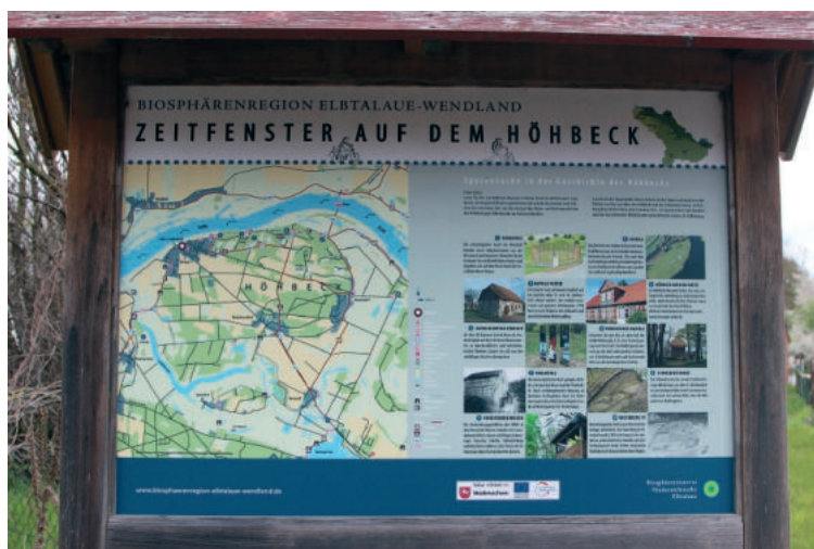
Abb. 1. „Zeitfenster“ – Übersichtstafel zur Besucherinformation am Höhbeck-Museum in Vietze Fig. 1. “Window in time” – an information board in Höhbeck-Museum in Vietze Ryc. 1. „Okno w czasie” – tablica informacyjna w muzeum Höhbeck w Vietze