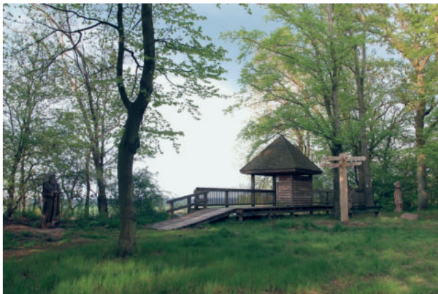
Abb. 11. Eine teilweise überdachte Aussichtsplattform erinnert entfernt an einen Wachturm und bietet zugleich Witterungsschutz. Zwei „Holzsoldaten“ in ihrem Umfeld beleben den Ort und schlagen eine gedankliche Brücke in die Vergangenheit

Fig. 10. „Guard“ greets visitors at the edge of the path after entering the Vietzer Schanze . Its aim is to draw attention to the fact that this is a special place and arouse curiosity to explore the place Ryc. 10. „Strażnik“ pozdrawia zwiedzających na skraju ścieżki zaraz po wejściu do Vietzer Schanze . Ma on zwracać uwagę, że chodzi tutaj o specjalne miejsce, i wzbudzać ciekawość, by je poznać