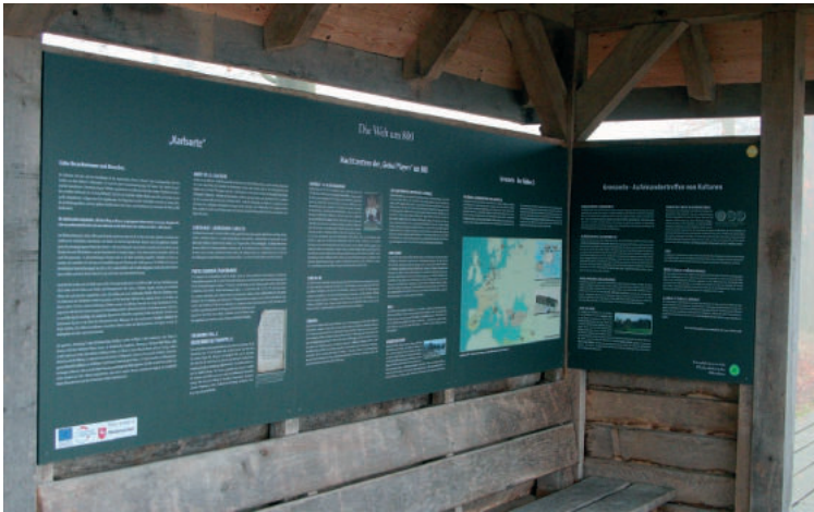
Abb. 16. An der Wetterschutzwand angebrachte großformatige Texttafeln und eine Karte liefern dem interessierten Besucher Informationen zum H6hbeck in karolingischer Zeit sowie zu den Orten, die auf dem Wegweiser genannt sind Fig. 16. Panels on the shelter wall and a map provide visitors with information about the H6hbeck in Carolingian Era and the places mentioned on the signpost Ryc. 16. Tablice na ścianie wiaty wraz z mapą zawierające informacje na temat H6hbeck w czasach karolińskich oraz miejsc zaznaczonych na znaku obok