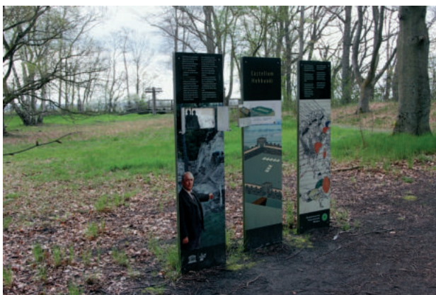
Abb. 12. Am südlichen Zugang zum Kastellplatz erläutern drei Informationsstelen die Geschichte der Erforschung der Vietzer Schanze. Sie sind Teil eines Entdeckerpfades und ersetzen eine ältere Informationstafel

Fig. 12. At the southern entrance to the fort square, three information boards explain the history of the exploration of the Vietzer Schanze . They are part of a discovery trail and replaced older information boards