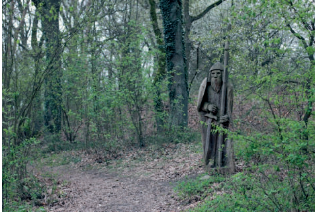
Abb. 10. Ein „Wächter“ begrüßt den Besucher am Wegesrand kurz vor dem Betreten der Vietzer Schanze. Er soll darauf aufmerksam machen, dass es sich hier um einen besonderen Ort handelt und Neugier wecken, diesen Ort zu erkunden

Fig. 10. „Guard“ greets visitors at the edge of the path after entering the Vietzer Schanze . Its aim is to draw attention to the fact that this is a special place and arouse curiosity to explore the place Ryc. 10. „Strażnik“ pozdrawia zwiedzających na skraju ścieżki zaraz po wejściu do Vietzer Schanze . Ma on zwracać uwagę, że chodzi tutaj o specjalne miejsce, i wzbudzać ciekawość, by je poznać