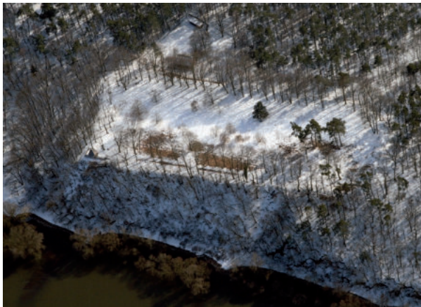
Abb. 4. Die Vietzer Schanze in einer Luftaufnahme am 25. März 2013. Gegen Süd. Im Vordergrund der Steilabfall zur Elbe.