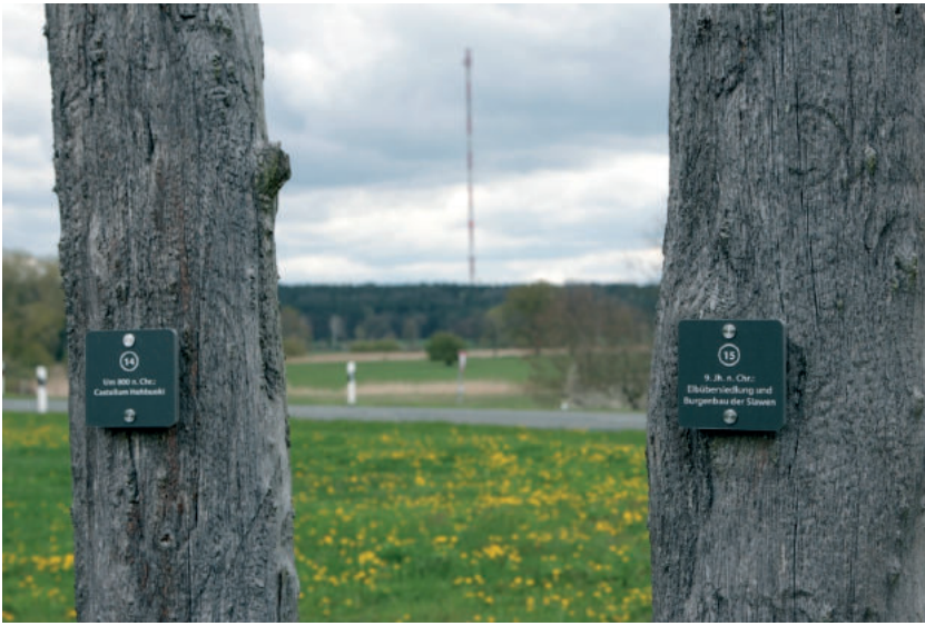
Abb. 6. Beispiel für die Beschriftung der Pfosten des Pfostenkreises als Zeitfenster. Die Nummerierung verweist auf die Broschüre

Fig. 6. Example of the labelling of the circle posts as a “window in time”. The numbering refers to the brochure