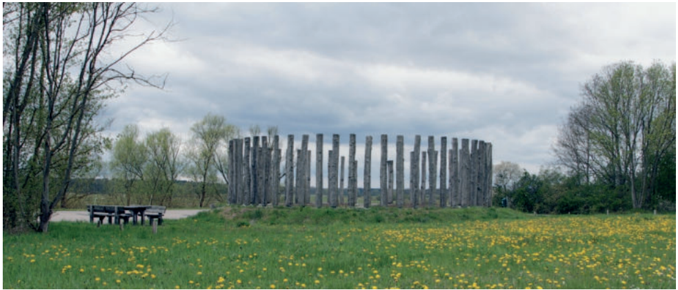
Abb. 7. Das „Woodhenge“ vom Hühbeck – der Pevestorfer Pfostenkreis auf einer Deicherweiterung bei Restorf am Fuß des Hühbecks. Er bildet den Knotenpunkt im Zeitfensterprojekt

Ryc. 6. Przykład oznaczenia słupów z kręgu jako „okno w czasie”. Numery są odniesieniami do broszury informacyjnej