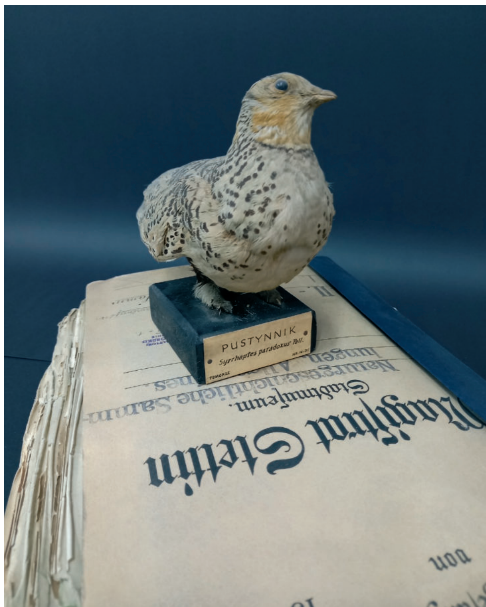
Ryc. 6. Okaz pustynnika zdobyty na Pomorzu w roku 1863 lub 1888 z kolekcji Museum der Stadt Stettin – Naturkundemuseum . Robien wspomina o tym okazie w swojej książce Die Vögelwelt des Bezirkes Stettin (1920). Ze zbiorów MNS – Muzeum Morskie.

Fig. 6. Specimen of the Pallas's Sandgrouse collected in Pomerania in 1863 or 1888 from the collection of the Museum der Stadt Stettin – Naturkundemuseum . Paul Robien mentions this specimen in his book Die Vögelwelt des Bezirkes Stettin (1920). Archives of the National Museum in Szczecin – Maritime Museum.