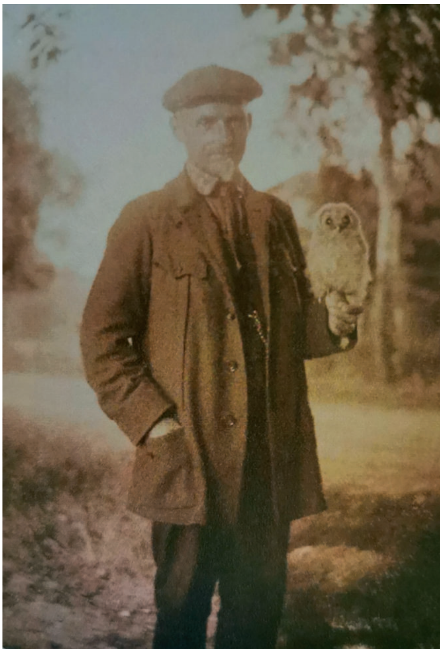
Ryc. 1. Robien z młodym puszczykiem w Park des Arndt Stifts Stettin (obecnie Park Słowackiego w Szczecinie), 1918 rok. (Ruthke 2016)